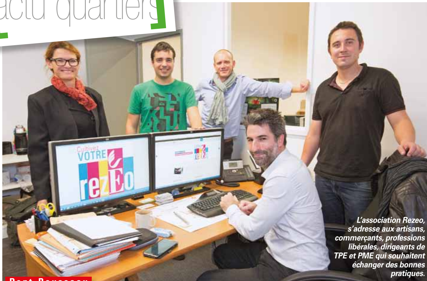
L'association Rezeo, s'adresse aux artisans, commerçants, professions libérales, dirigeants de TPE et PME qui souhaitent échanger des bonnes pratiques.